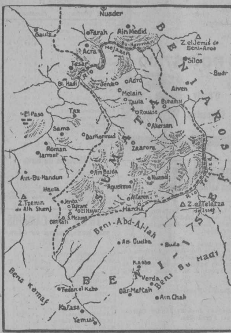
Mapa de la Kabila de Sumata, rodeada por las tropas españolas.

En los periódicos de Madrid de fines de Mayo, vemos una relación bastante detallada, por cierto, de las operaciones que realizaron las tropas españolas después de haber acorralado al Raisul en Buhasen; pero antes de pasar a hacer la descripción de modo gráfico se puede seguir en el mapa que se acompaña a este artículo, debemos hacer algunas apreciaciones sobre las declaraciones que el General Berenguer hizo el día 22 de Mayo sobre la situación de la campaña en general.