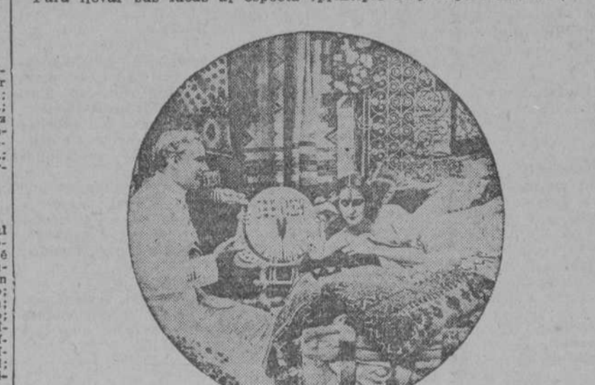
Una escena culminante de la grandiosa película "ATLANTIDA"

Por su parentesco con la egipcia, la civilización atlantea tiene como fundamento la preocupación del problema de ultratumba y como medios sociales, los mismos de los egipcios. En lo que se refiere al arte, los atlantes aglomeraron un poco el concepto estético embelleciendo sus obras con la gracia y brillantez del estilo oriental que bebiéron los cartagineses de los sidonios y damascenos.