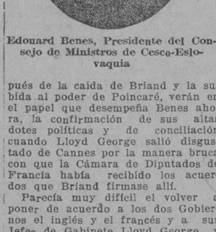
Edouard Benes, Presidente del Consejo de Ministros de Checoslovaquia