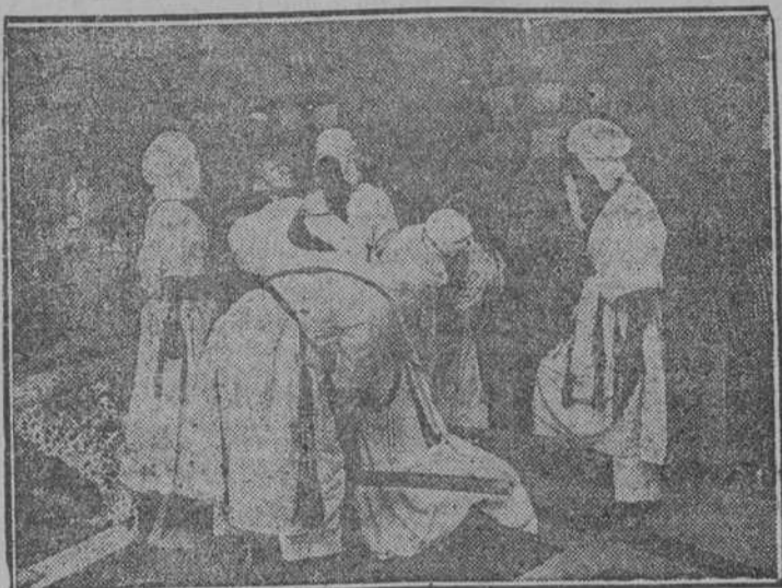
Una escena culminante de la grandiosa película "ATLANTIDA"

Alrededor de la maravillosa versión cinematográfica de la novela de Pierre Benoit