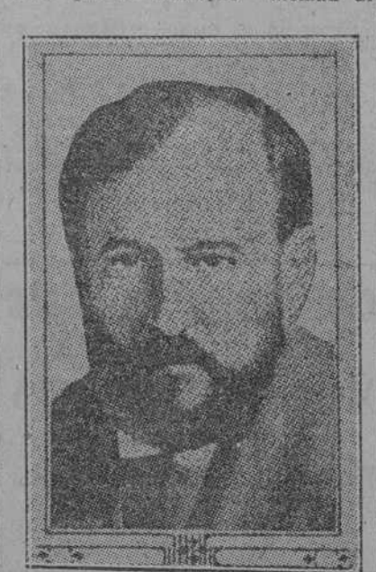
CHRISTIAN GEORGEWITCH RAKOWSKY