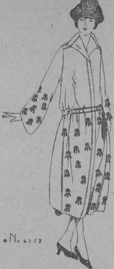
LA CAPA DE LA JOVENITA PUEDE ADORNARSE CON CINTAS