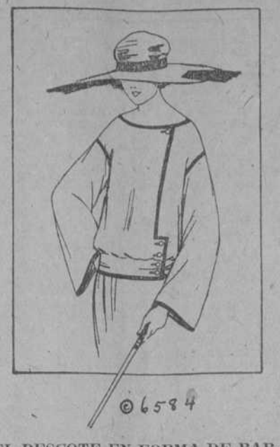
EL DESCORTE EN FORMA DE BARCO Y LAS MANGAS ANCHAS CONSERVAN SU POPULARIDAD