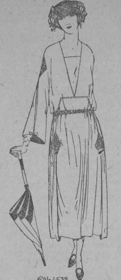
UN SENCILLO TRAJE DE CALLE

Las líneas largas y sencillas de este traje lo hacen especialmente adaptable para confeccionarse de crepón de la China, al punto que la original disposición del frente de la falda y los paneles de los lados sugiere en seguida el uso de primorosas aplicaciones o crepón de contrastantes o un motivo de bordados.