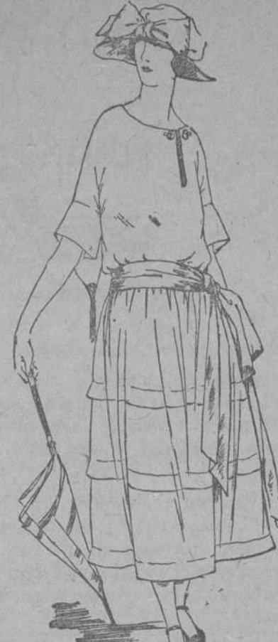
EL TRAJE DE FALDA ANCHA RESULTA ENCANTADOR EN ORGANDI

La aprestada frescura del organdi se adapta encantadoramente para un traje de tarde con el cuerpo suavemente abalado sobre el talle bajo y la falda moderadamente acambrada. La banda de moaré establece un bonito contraste tanto en el color como en el tejido.