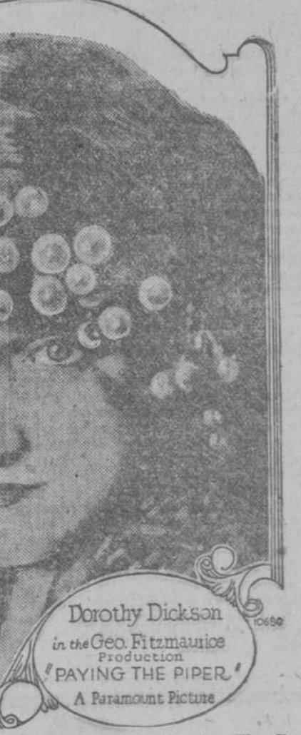
Dorothy Dickson, principal intérprete en la película "Paying the Piper" de la "Paramount".

que ella no se resolvía a abandonar las tablas, como en una de las cláusulas del convenio se le exigía. Fuera que en su posterior actuación teatral Norma no alcanzara ningún triunfo tan categórico como el que había obtenido en su primer ensayo de actriz de cinematógrafo, fue la que alguna influencia ejercieran esta nueva literatura de la pantalla se hall en sus comienzos. Ha atraído a los hombres y a las mujeres de intelecto más brillante, a los genios de las respectivas artes, que están estudiando con ahínco más y más el medio de mejorar sus propios esfuerzos y los esfuerzos de los demás. A los estudios de las grandes compañías viene ahora los más grandes autores y dramaturgos del mundo que se hall juntados para aprender concienzudamente la técnica de la pantalla con el fin de escribir obras