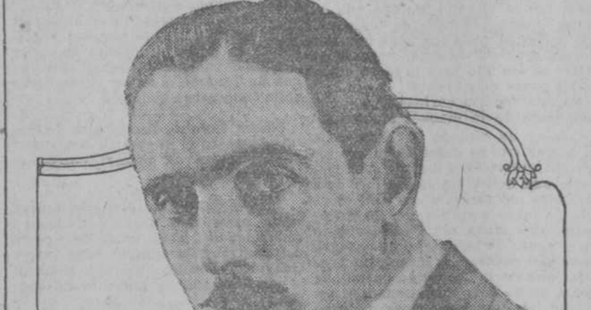
David Powell de las Películas "Paramount"