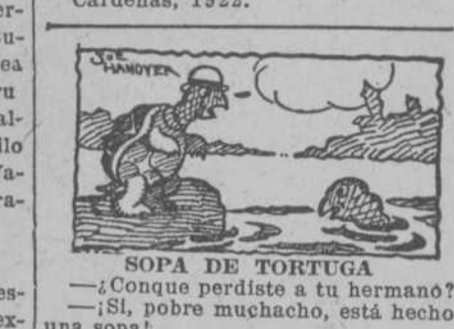
SOPA DE TORTUGA

—¡Conque perdiste a tu hermano? —¡Sí, pobre muchacho, está hecho una sopa!