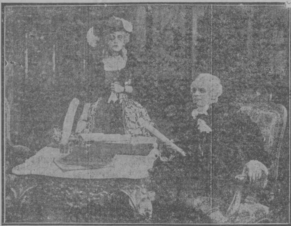
Una interesante escena de la grandiosa película "PASION" o "MADAME DU-BARRY."

Pocos días faltan para el estreno en el Teatro "Campomar" de la más grandiosa película que en tiempo alguno haya sido producida. Se trata de "Pasión," la soberbia reconstrucción de una brillante página de la historia francesa, época en que la veleidosa figura de una mujer se adueña del corazón de un monarca, haciéndolo juguete de sus caprichos. Tuvo, no obstante, esta Madame Du Barry, también, la desgracia de sentir los efectos de una pasión batallando en su alma, ella también supo de ese pesar que significa un amor contrariado; y todo ello, de manera asombrosa, ha sido recogido por el cinematógrafo, realizando con esta magna obra de traer a nuestros días un drama que se desarrolló en época pasada, uno de los más grandiosos acontecimientos del progreso humano. Esta película, que ha sido la revolución artística del mundo entero, ha despertado en la Habana gran sensación y al sólo anuncio de su estreno durante los días 9, 10 y 11 en el Teatro "Campomar," se ha visto como el interés por conocerla ha sido grandioso. Podemos asegurar que "Pasión," por la excelente actriz Pola Negri, ha de ser el éxito más grande que registre la historia del cine en Cuba, tal es lo que sugiere la sublimidad del soberbio espectáculo.