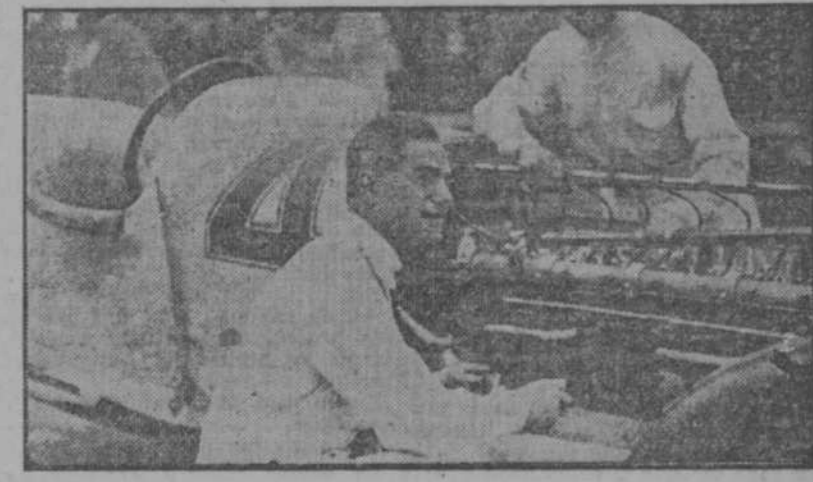
Ralph de Palma, no abandona su eterna sonrisa ni en los difíciles momentos de un ajuste recalcitrante de su motor.

Evidencias de faltas en el motor son: ruido, calor excesivo, operación incorrecta y cesación completa de su funcionamiento. Al tratarse de faltas en el embrague y tren de engranajes, todas estas evidencias se pueden presentar, con excepción de la del calor excesivo. Solo en casos muy aislados hay excesivo calor en el embrague o tren de engranajes. El Embrague de Cono, Para determinar si hay resbale en el embrague se procede a la siguiente prueba: las ruedas posteriores del automóvil se colocan contra el canto de la acera de la calle. Se aplica el embrague, teniendo el engranaje de alta velocidad conectado. Se pone en marcha el motor. Si el embrague se encuentra en buenas condiciones de operación, el automóvil debe entonces salir la acera o bien el motor debe cesar de funcionar. Si el motor continúa funcionando y el automóvil se deja de subir la acera, quiere decir que el embrague está resbalando. El resbale se puede atribuir a dos defectos: ajuste suelto o revestimiento muy gastado del embrague.