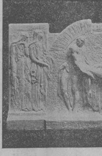
Boceto del "Entierro de Cristo" enviado desde Madrid a la Secretaría de Instrucción Pública y Bellas Artes por el pensionado señor Oliva Michelena.

brar sus haberes una parte del personal del departamento de Limpieza de calles, ofreciéndoles continuar el pago a los demás obreros de aquel Negociado de las quinceñas que se les deben.