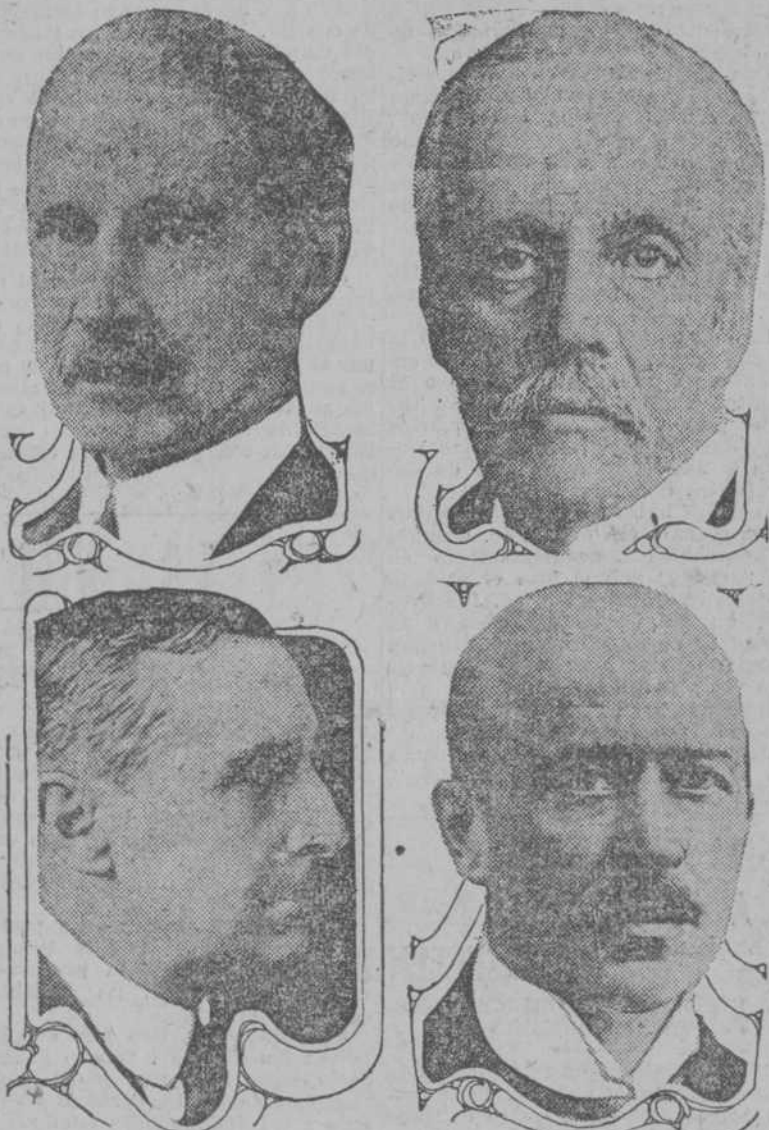
De izquierda a derecha, línea superior: Hon. A. J. Balfour y Andrew Bonar Law. Debajo: Lord Lee de Fareham y Sir Laming Worthington-Evans.