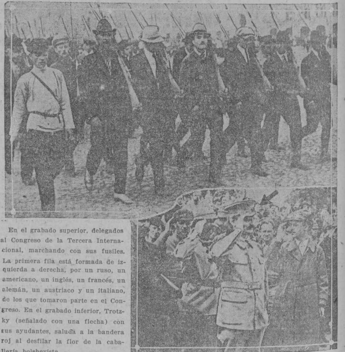
En el grabado superior, delegados al Congreso de la Tercera Internacional, marchando con sus fusiles. La primera fila está formada de izquierda a derecha, por un ruso, un americano, un inglés, un francés, un alemán, un austriaco y un italiano, de los que tomaron parte en el Congreso. En el grabado inferior, Trotsky (señalado con una flecha) con sus ayudantes, saludó a la bandera roja al desfilar la flor de la caballería bolsevista.