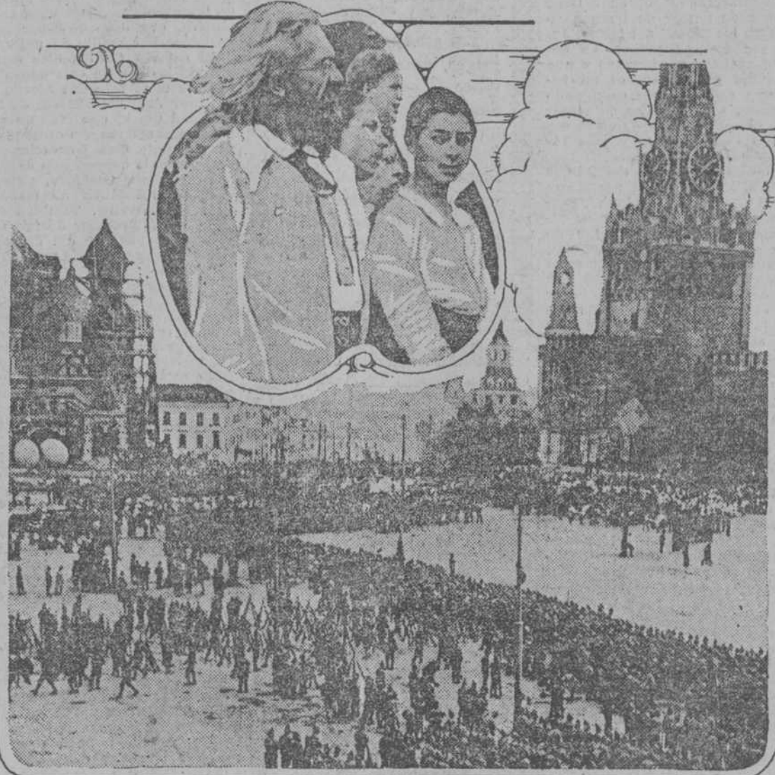
Desfile de las tropas del ejército bolsevista junto al Kremlin de Moscow, que aparece a la derecha. A la izquierda véanse obreros reparando la catedral de San Basilio. En el grabado central tiene por objeto hacer quedar bien a los que dicen que los comunistas son melencolios, mientras que los comunistas van peladas. Son tipos delegados a la Tercera Internacional.