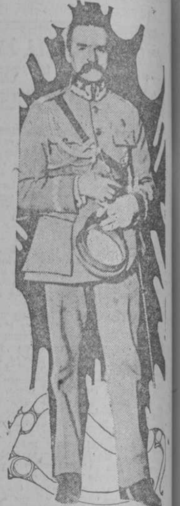
A los tres días de la dimisión del gabinete Wito, se hablaba de la posibilidad de que el general Pilsudski asumiese la dictadura o se hiciera rey de Polonia. El partido militarista austro-polaco, el cual es jefe el general Pilsudski, está trabajando en favor de que se llegue a esa finalidad desde hace diez y ocho meses cuando echó del poder al planista Paderewski.

esa concesión no les hará justicia, porque el costo de la vida ha sido multiplicado en más de diez veces sobre el anterior, y el valor del oro, cerca de veinte veces, mientras que las rentas han producido pérdidas en la mayor parte de los casos, porque el producto de los alquileres apenas si ha bastado para el mantenimiento de las propiedades.