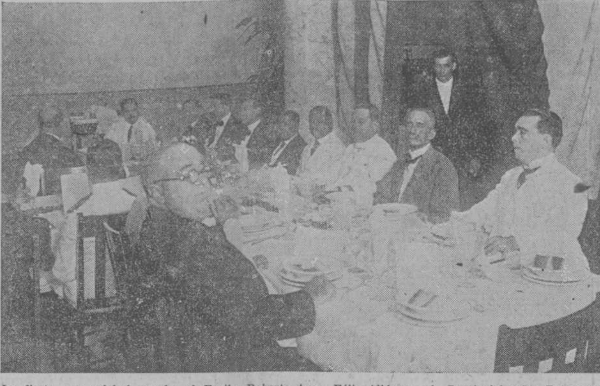
La fiesta que celebró anoche el Club Atenas, en el Hotel Oriental fué una elegante demostración del prestigio de que goza esa institución, organizada por los más valiosos elementos de la raza de color.