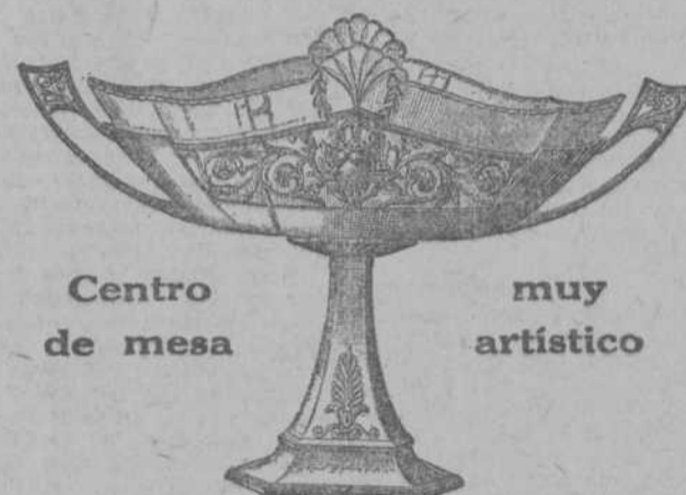
Centro de mesa muy artístico