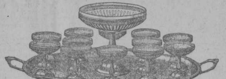
Precioso servicio de helados.