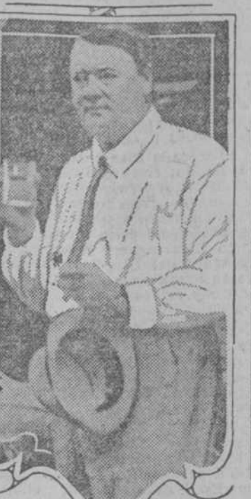
Lord Northcliffe. Este es la primera copa de agua que bebo desde que salí de Inglaterra, me manifestó a un repórter en Honolulu respecto a la prohibición de "cores en los Estados Unidos de América.

domnios, tenía la soberanía de los Países Bajos. Este hecho parece constituir el punto de partida en que se basa la reclamación del tesoro, que depositado en Gijón, fué trasladado después a Bruselas.