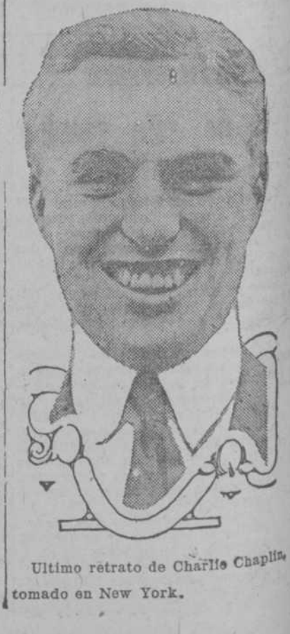
Ultimo retrato de Charlie Chaplin tomado en New York.