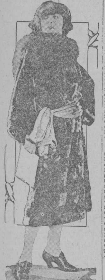
Preclara modelo desafiando los rigores del verano.

cerca de la conveniencia de proceder a la rotura, o no, porque no siempre el ánimo está dispuesto para sufrir grandes emociones, se me ocurrió abrir el paquete.