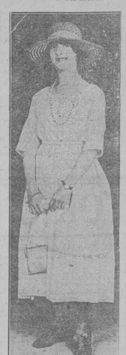
Este sencillo traje le costó a su dueña la pequeña suma de 25 centavos.

—Este sencillo traje le costó a su dueña la pequeña suma de 25 centavos.