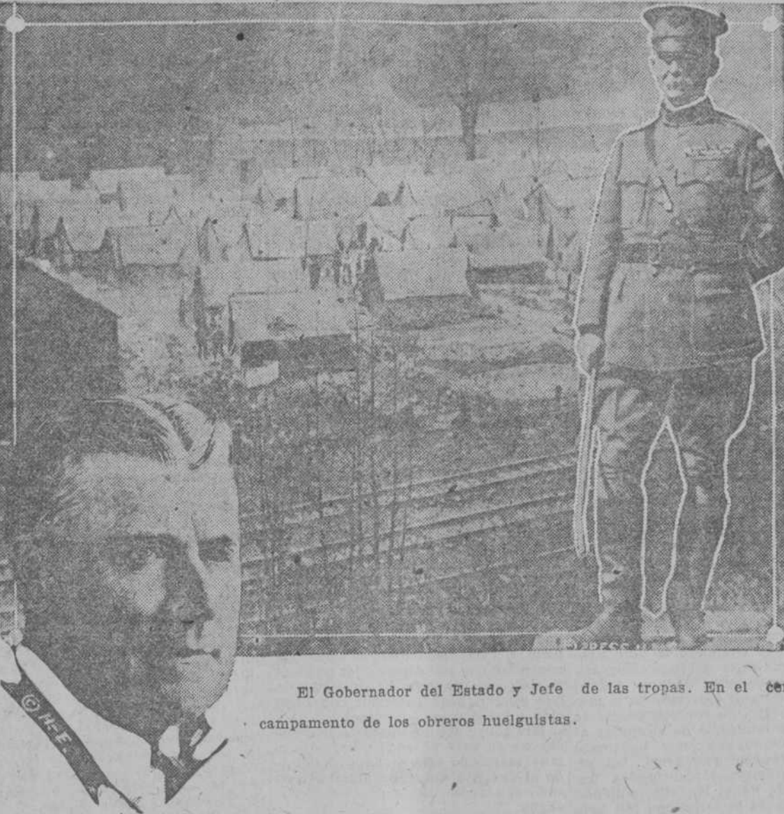
El Gobernador del Estado y Jefe de las tropas. En el centro el campamento de los obreros huelguistas.