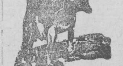
L. BLUM Recibi hoy

HUEVOS DE GALINA PARA CRIA muy frescos, garantizados, 20 centavos cada uno. Razas: Catalán del País, Brahmas, Kecks, etc. Interior, 33, 50 docena, fruta y empaque libres. Precios ejemplares de gallinas, siete variedades, machos y hembras, de todas razas, pollos, remedios. Instalamos gallineros y parques avícolas. Granja Avícola Ambar, Ciudad Alibón, Los Pinos, Habana. 26 ag.