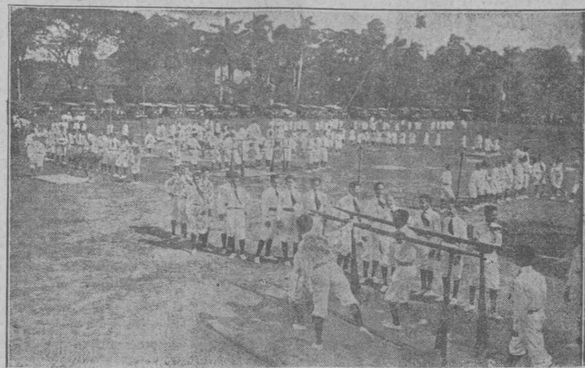
Un aspecto del campo de sport durante los ejercicios en 32 aparatos, por todos los alumnos del Colegio.

UN EXITO SOCIAL Y DEPORTIVO.—EL PROFESOR HEIDER SABE INCULCAR A SUS ALUMNOS EL AMOR A LA PATRIA.