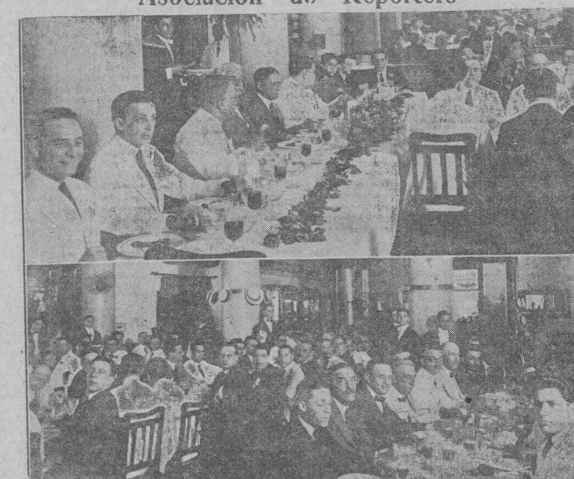
ARRIBA: LA MESA PRESIDENCIAL.—ABAJO: UN ASPECTO DEL BANQUETE.

Un gran éxito, por todos conceptos, resultó ayer el tradicional almuerzo que la Asociación de Reporters de la Habana, celebra anualmente la toma de posesión de su nueva Directiva.