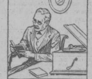
IDIOMAS SIN MAESTRO. Puede usted aprenderlos prácticamente con el 'Cortinophone' maravilloso invento...