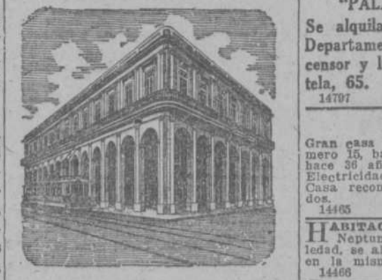
HOTEL GLORIA CUBANA