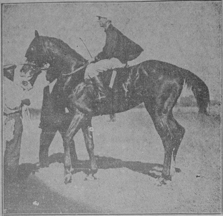
"GEN. MENOCA", el más formidable opositor de "BILLY BARTON", en el Cuban Derby, la rica justa que se discute mañana domingo en Oriental Park con premio de $15,000 y cuotas

LAS CARRERAS DE AYER TARD.— EL PROGRAMA PARA HOY