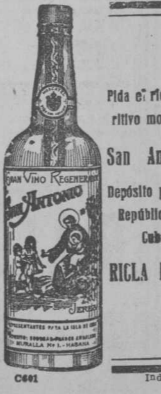
Pida el rico aperitivo moscatel San Antonio