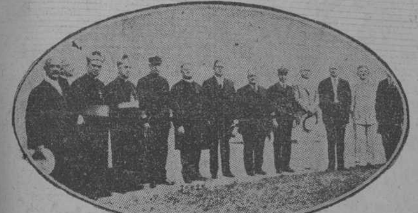
El jefe supremo de los Caballeros de Colón, el obispo de Buffalo, el obispo de Washington y el almirante Benson, concurrentes al acto de condecorar al Supremo Caballero.