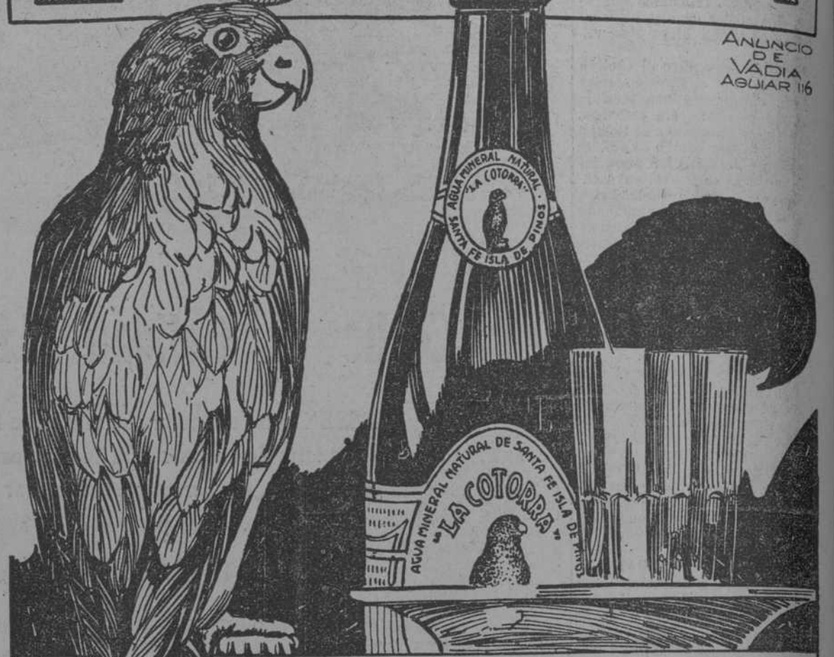
ANUNCIO DE VADIA AGUIAR 116