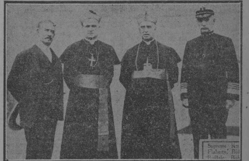
Los jefes supremos de los Caballeros de Colón, con el almirante Benson, antes de la apertura de la Convención.