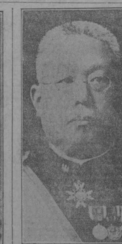
El doctor Yamagata, administrador general de los asuntos coreanos, una de las figuras más prominentes del Japón.