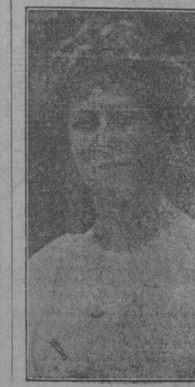
Ultimo retrato de la Princesa María, de Inglaterra, que pronto contraerá matrimonio por haber llegado a la mayoría de edad.