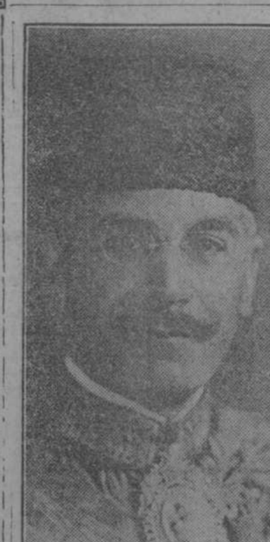
Sdaigh-El-Sullanés, nuevo ministro de Persia en los Estados Unidos.