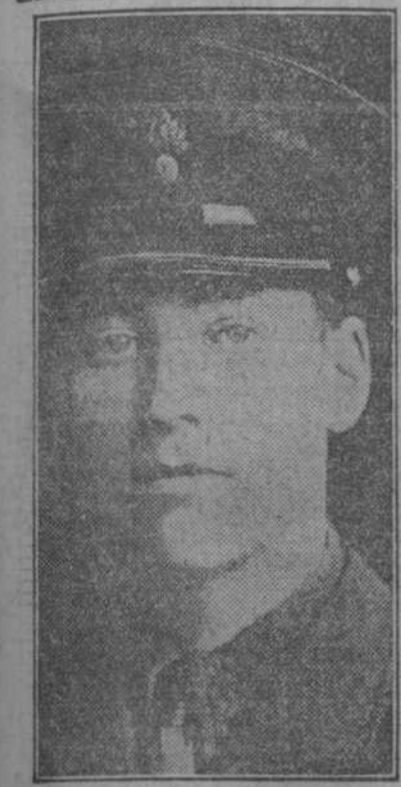
El Conde de Dalkeith, de quien se dice que contraerá matrimonio con la Princesa María, única hija del Rey de Inglaterra.

Washington, Agosto 18. Un congreso internacional de obreros se ha convocado por la Liga Nacional Americana de Obreros, el