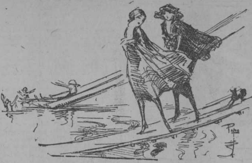
Ropa de baño para señoras, caballeros y niños

Tenemos el surtido completo de estos artículos. Llamamos la atención, especialmente, acerca de nuestra colección de capas de baño para señoras. Estilos del mejor gusto.