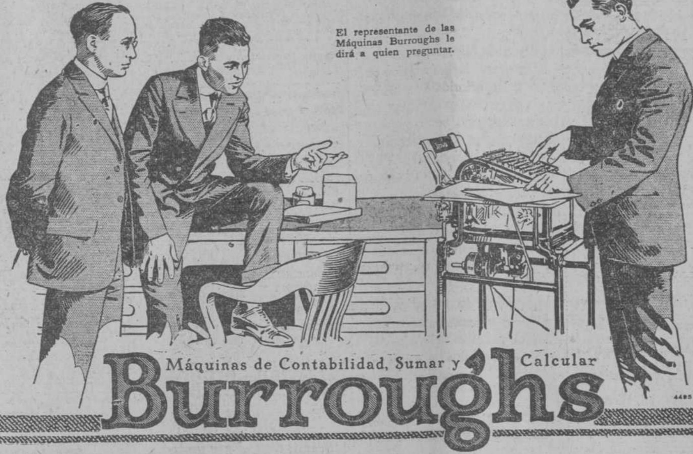
El representante de las Máquinas Burroughs le dirá a quien preguntar.

Burroughs Adding Machine Company, Detroit, Michigan, E. U. A. Agentes Exclusivos de las Máquinas Burroughs en Cuba Frank Robins Co., Habana