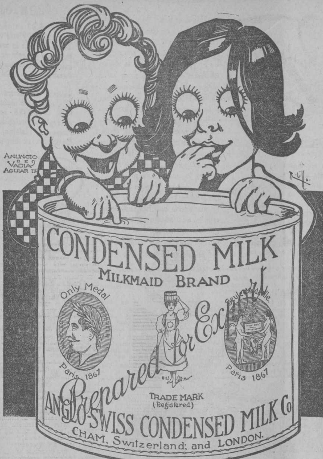
LECHE "LECHERA" El alimento de los niños.