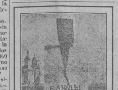
Primer monumento bolcheviki erigido en Moscú. Consiste en un bloque de granito con este lema: "Antiguo régimen" y un hacha de hierro, rajando dicho bloque, con el lema "Nuevo régimen."

LAS COLONIAS QUE FUERON ALEMANAS Paris, Julio 17. La Comisión de la Cámara de Diputados que estudia el Tratado de Paz, trató hoy de las Colonias alemanas. El informe dice que la devolución de Togoland y Kamerun a Francia, no hace más que restablecer el derecho que le asiste a Francia, desde el punto de vista político. Agrega, sin embargo, que "un acuerdo reciente entre Francia y la Gran Bretaña fija las limitaciones y derechos de cada una de ellas en dichas Colonias."