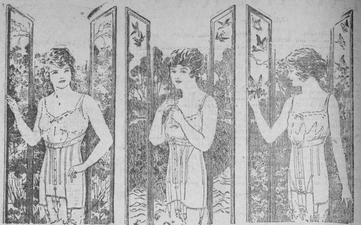
Talle Esbelto. Figura Graciosa. Líneas Elegantes

Avenida de Italia, 71. Tejidos, Sedería y Confecciones