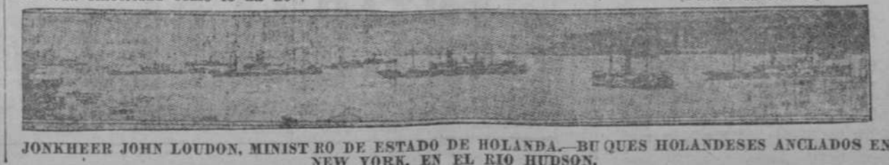
JONKHEER JOHN LOUDON, MINISTRO DE ESTADO DE HOLANDA.—BUQUES HOLANDESES ANCLADOS EN NEW YORK, EN EL RIO HUDSON.