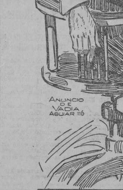
ANUNCIO DE VADIA AGUIAR 116

Pero no deben olvidar ellos que cuando al ilustre Calixto García se hizo la indicación de que el auxilio de los Estados Unidos podía significar la anexión; cuando se recordó que Narciso López—uno de nuestros mártires venerados—vino con soldado americano y dinero americano a trabajar por la anexión; cuando con la historia en la mano y las profecías de Saco a la vista, se temió que tras la intervención viniera la incorporación a plazo más o menos largo, exclamó: "Que nos ayuden a arrojar a España, y venga lo que venga después."