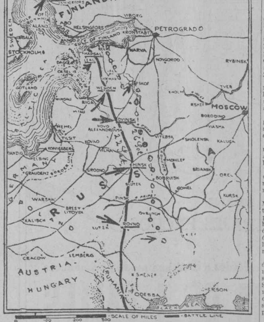
La línea negra y las flechas representan el frente ruso y los puntos que ocuparon los alemanes hasta el 22 del corriente, desde Finlandia a Ucrania. La línea de círculos y guiones fija el avance alemán hasta el día de ayer. En esa línea hay dos flechas donde la resistencia rusa ha existido; en Pskov, camino de Petrogrado y en la Ucrania, camino de Kief.