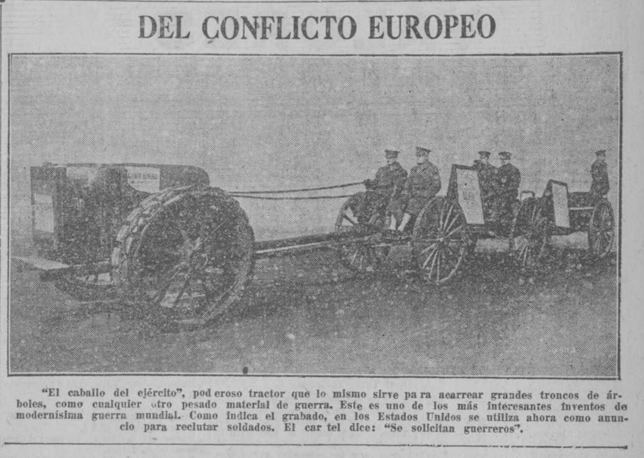
“El caballo del ejército”, pod eros tractor que lo mismo sirve para acarrear grandes troncos de árboles, como guerra mundial. Como indica el grabado, en los Estados Unidos se utiliza ahora como anuncio para reclutar soldados. El cartel dice: “Se solicitan guerreros”.