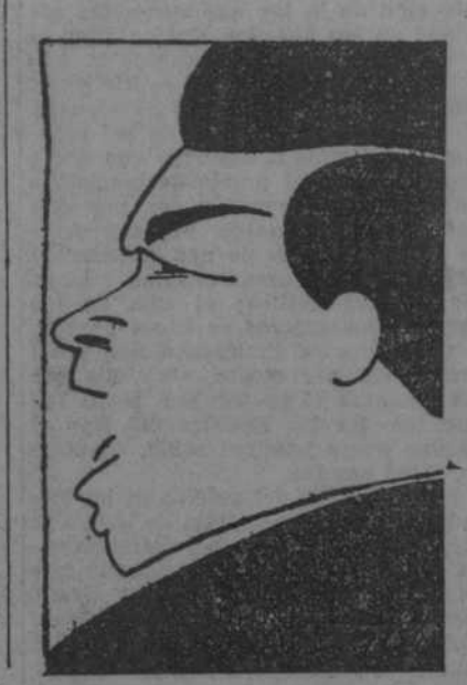
El notable tenor Manuel Salazar crecida de nombres españoles. LAZARO Y LA TEMPORADA DEL METROPOLITAN