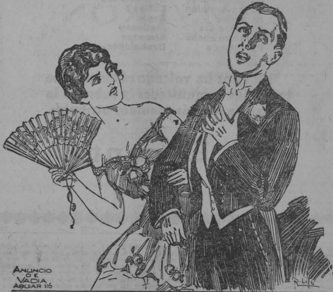
ANUNCIO DE VADIA AGUIAR 116

Repertorio exclusivo de "La Universal." MARTI. En primera tanda, "Bohemios", por Luisa Bonoris. En la segunda, "El Cabo Primero" En la tercera, "Enseñanza libre".