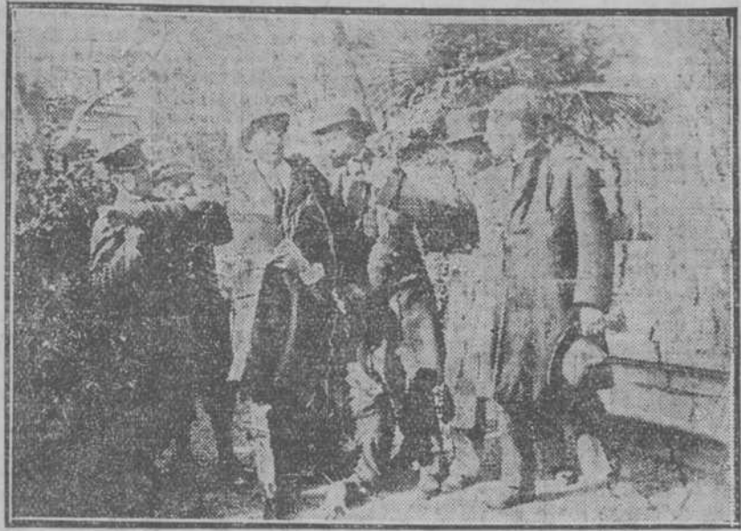
El falso Marqués de Chamblais, es detenido por la policía, y conducido como autor del miserable asesinato de la infeliz Iveter...