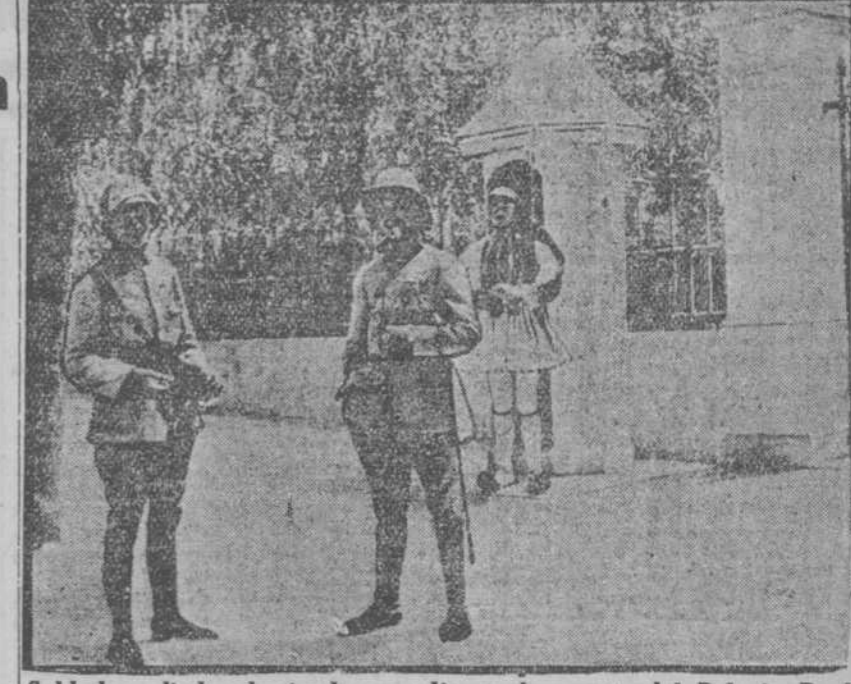
Soldados aliados haciendo guardia en la puerta del Palacio Real de Atenas.