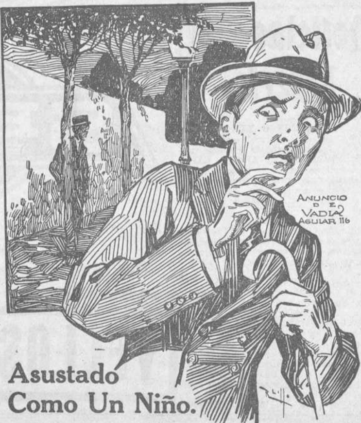
ANUNCIO DE VADIA AGUIAR 116