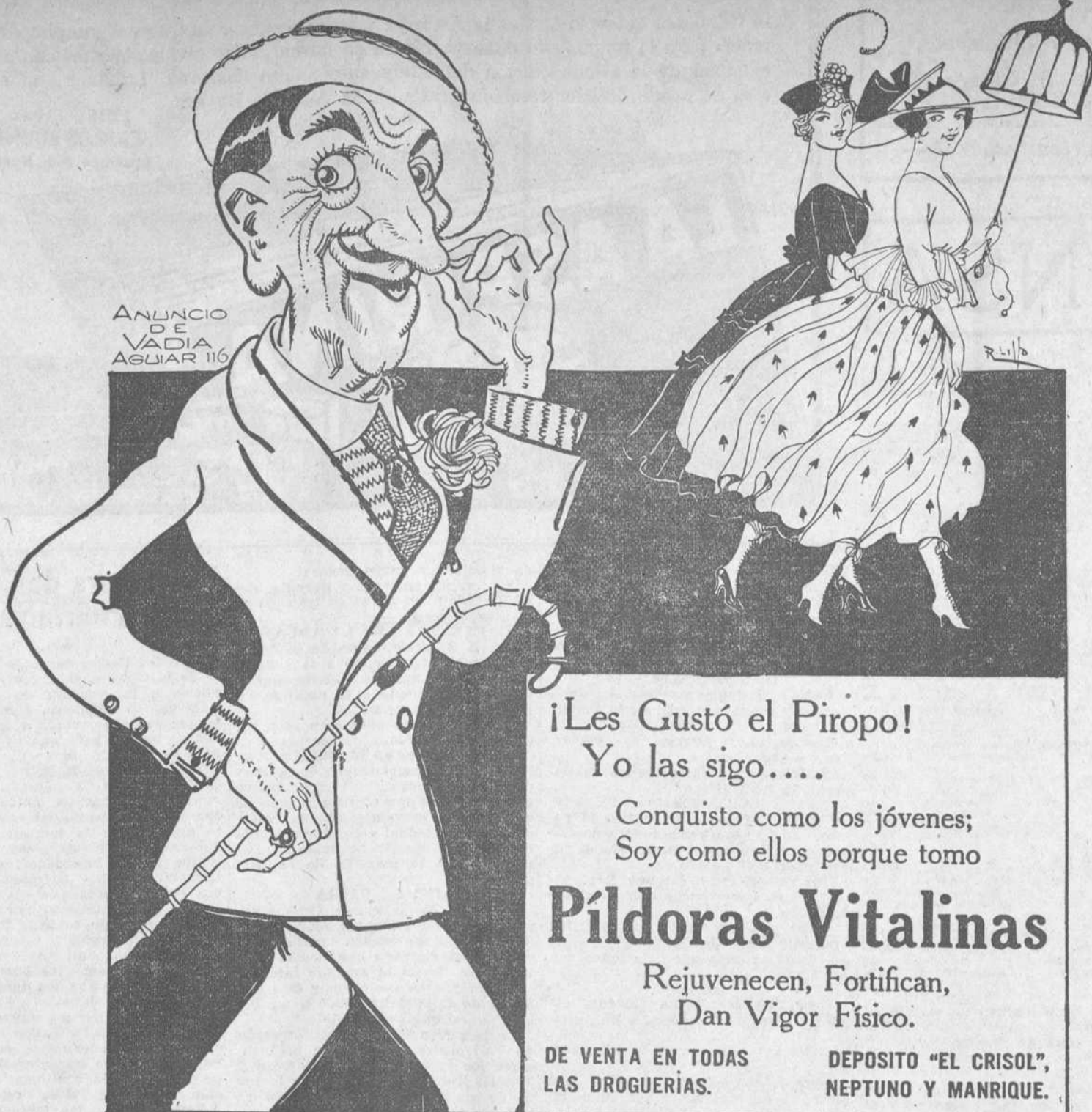
ANUNCIO DE VADIA AGUIAR 116

Cura la debilidad en general, escrófula y raquitismo de los niños. PREMIADA CON MEDALLA DE ORO EN LA ULTIMA EXPOSICION