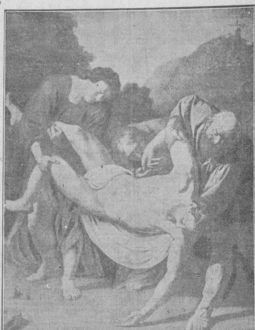
EL ENTIERRO DE CRISTO (Cuadro de Corregio, existente en el Vaticano de Roma.)