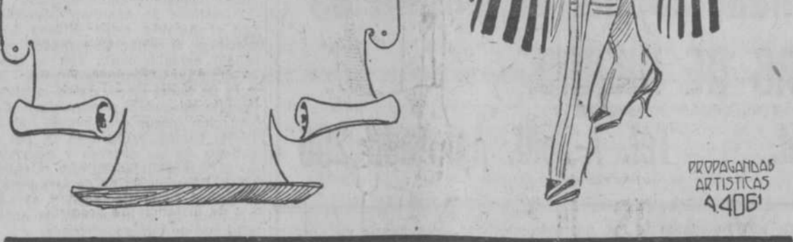
PROPAGANDAS ARTISTICAS 44061

Una mujer que tenía perturbadas las facultades mentales pasó por aquellos uno de estos días últimos, cuando la capa de nieve que por allí existía era de gran espesor.