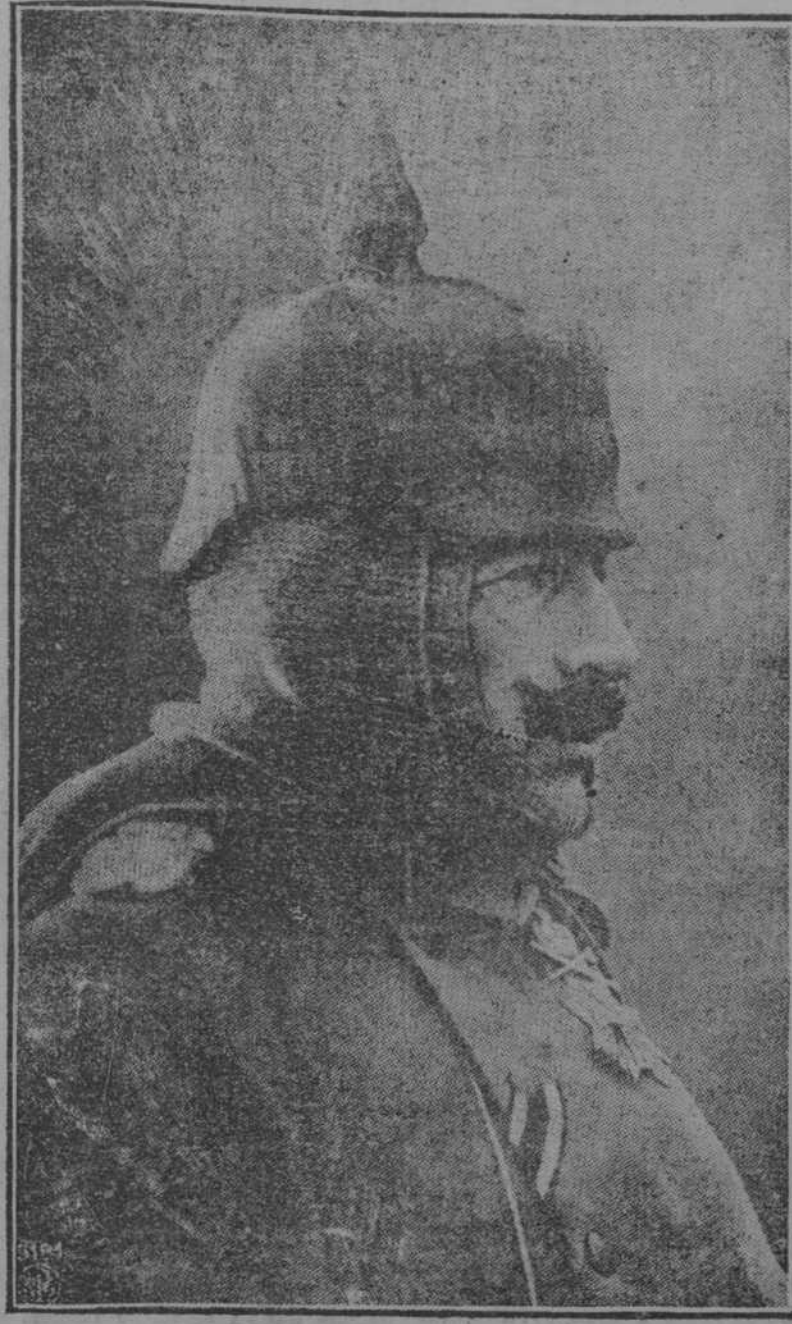
Ultima fotografia del Kaiser, hecha en el campo de batalla

La opinión general se inclina a la creencia de que el gobierno puede hacer algo que alivie la presente aflicción. (PASA A LA PAGINA SEIS)