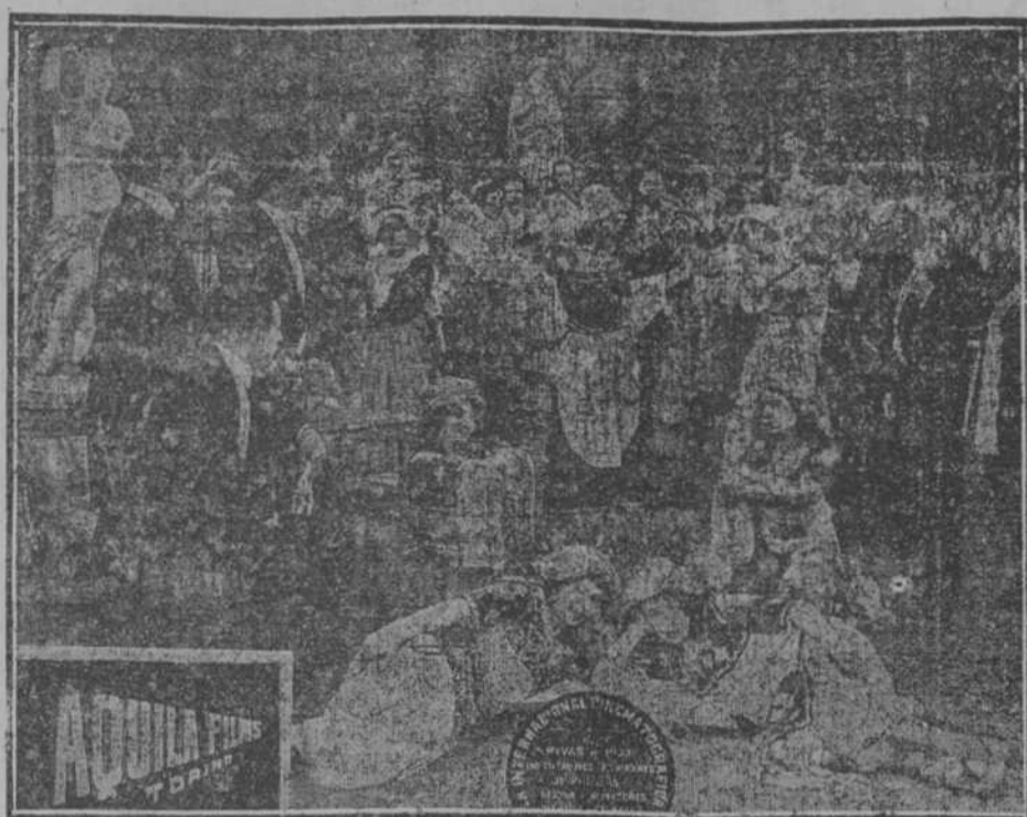
En el ánimo de todos los invitados está bien lejos la idea de que la rica heredera, disfrazada de humilde campesina y aprovechando el bullicio y la animación de aquella fiesta, huirá para siempre con el hombre que es dueño de su albedrío.

Pida, con tiempo, su localidad numerada al Teléfono A-432