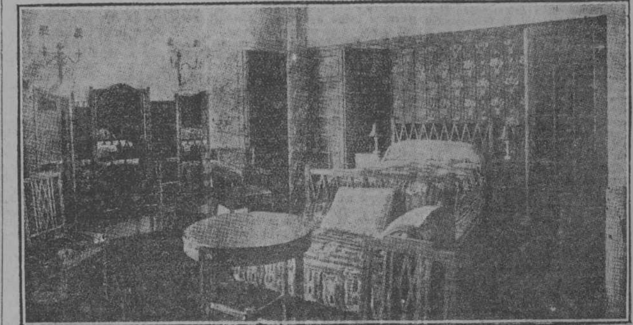
Habitación del piso principal, destinada a S. A. R. la Infanta D.ª Isabel