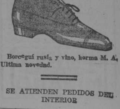
Boregú rusia y vino, horma M. A. Última novedad.