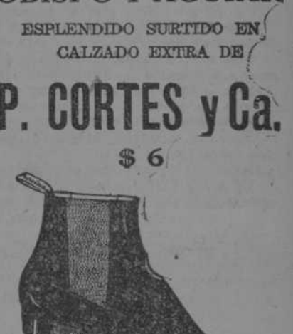
Botín glacé negro, y de color, con y sin puntera, horma I.A.

OBISPO Y AGUIAR ESPLIENDIDO SURTIDO EN CALZADO EXTRA DE P. CORTES y Ca. $ 6