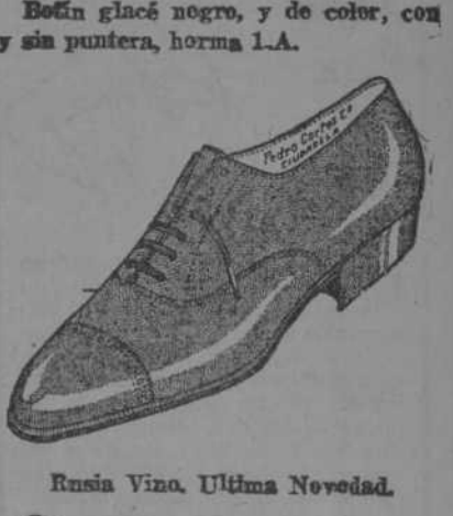
Rusia Vino. Última Novedad.