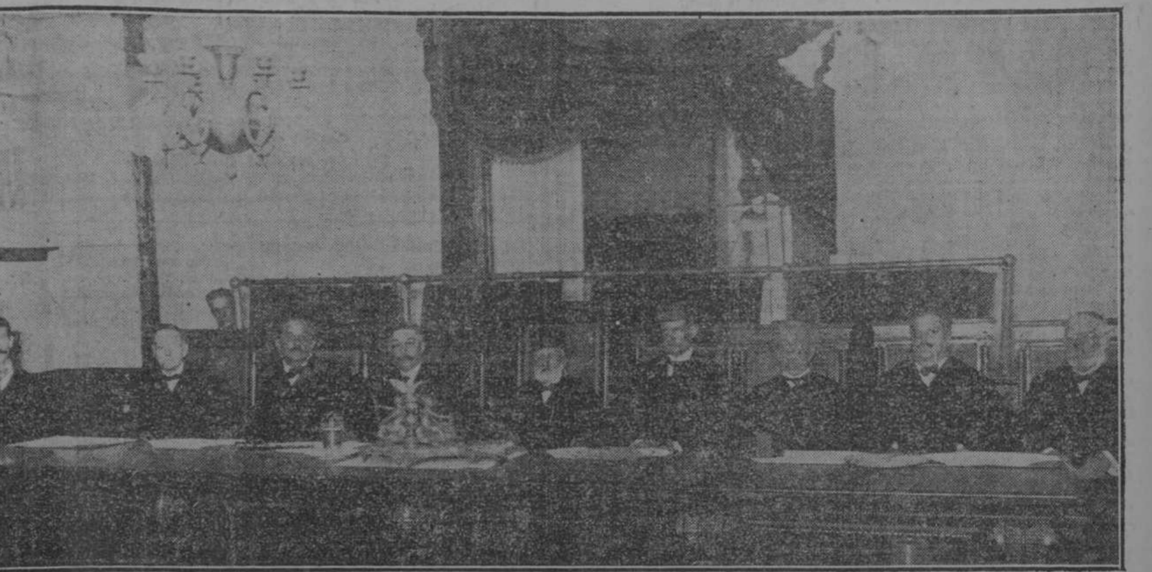
LA APERTURA DE LOS TRIBUNALES.—El Tribunal Supremo en pleno y el Honorable Secretario de Justicia.

LA REVOLUCION EN GRECIA Londres, Septiembre 1. Han ocurrido desórdenes en Salónica, agrega el correspondiente; pero la intervención de los soldados de los aliados de la Entente evitó que tomara mayores proporciones.