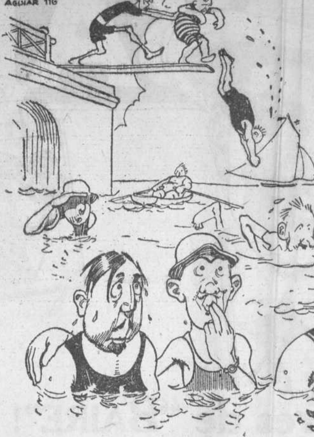
ARRIBADO VAPOR AGUAR 116