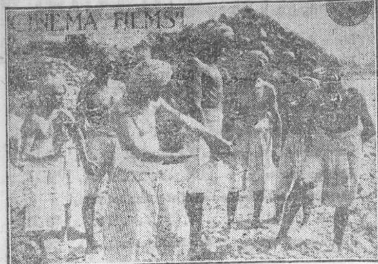
¡Júrame que matarás al Rajah, y me abrirás las puertas del Gran Tesoro!