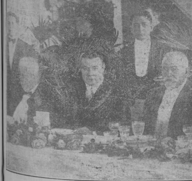
La presidencia de la mesa en el banquete celebrado ayer en Miramar.