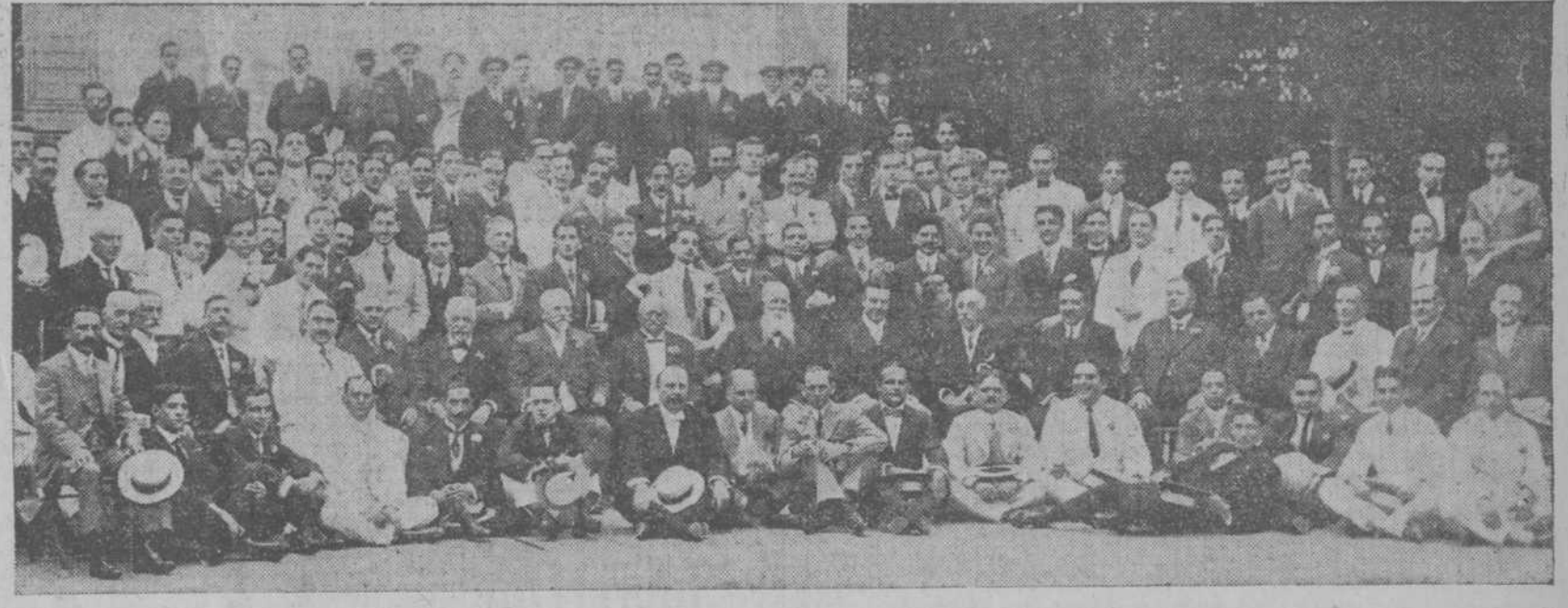
Grupo de los miembros del Consejo del Banco Español y de los empleados que asistieron al banquete celebrado ayer en "Miramar", en conmemoración del 60 aniversario de la fundación de dicha institución de crédito.