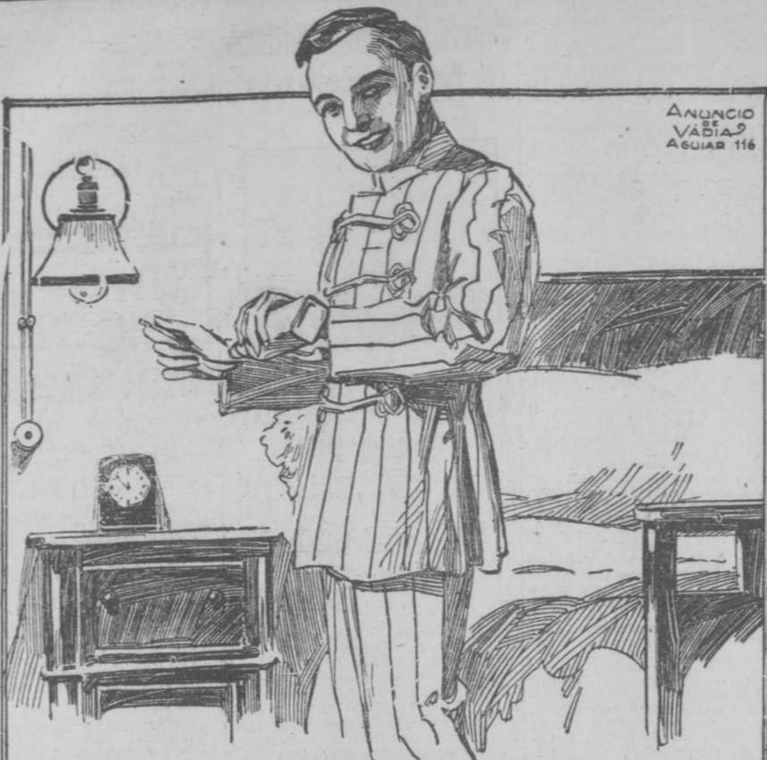
ANUNCIO VADIAS AGUIAR 116