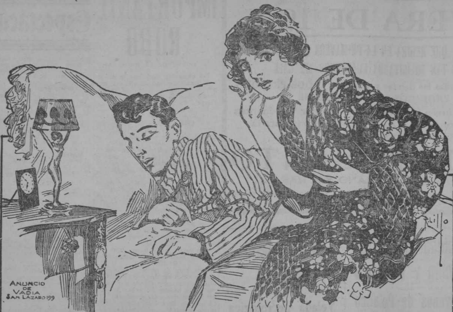
ANUNCIO DE VADIA SAN LAZARO 199