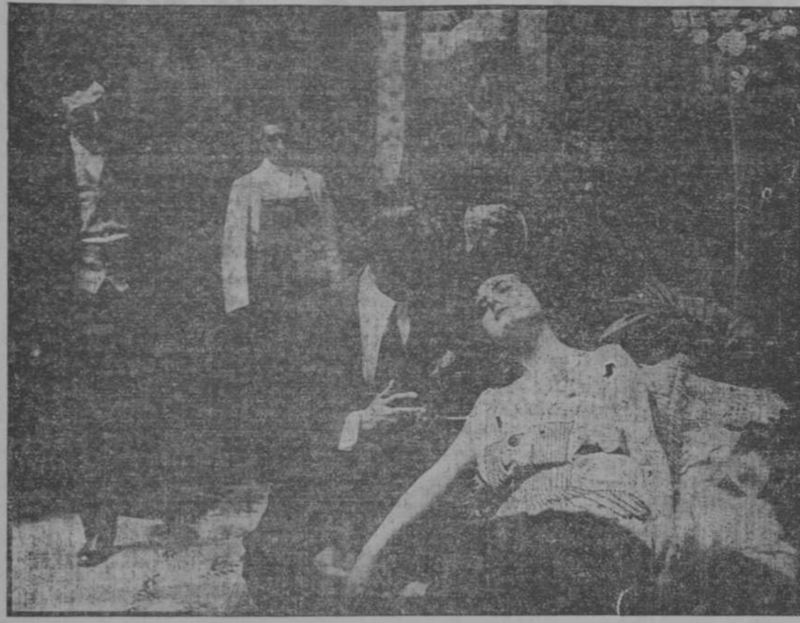
Al grito de Ivona acuden los criados y la encuentran exánime. La infeliz apache ha caído bajo el puñal de los cómplices que han creído herir a la Condesita. Ivona suplica al Vizconde que traiga a su prometida para demandar su perdón...