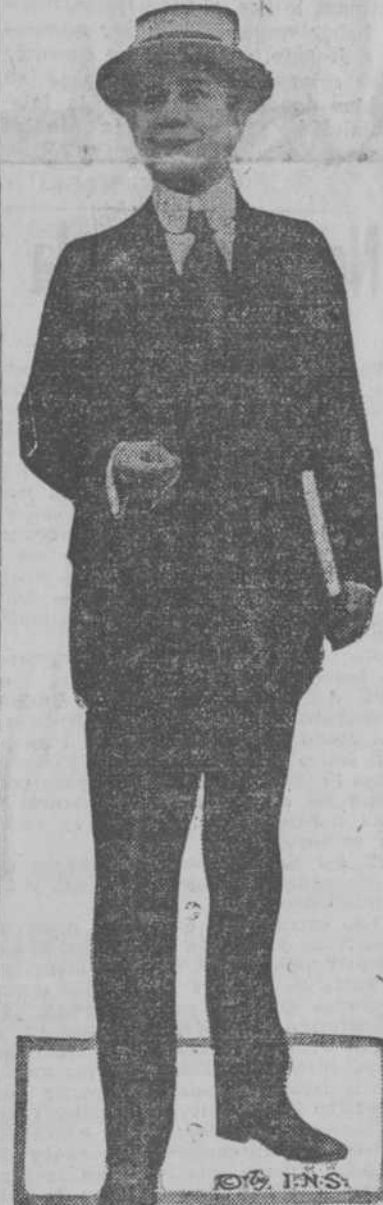
HARRY K. THAW

De Camajuani Julio, 20. Esta zona, cuya vida sólo depende del tabaco, atraviesa al presente año una situación algo crítica. Las casas aparceras de este producto, se abstienen en absoluto de comprarlo, sucediendo con ello, que una gran mayoría de los cosecheros, escogen el tabaco en sus respectivas casas, causa esta, que contribuya en grado sumo a la paralización del comercio en general.