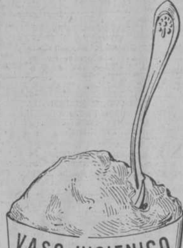
14497 10 as.