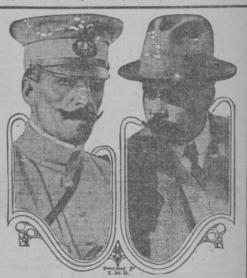
DOS CAUDILLOS MEXICANOS.—Esta interesante fotografía, muestra al público a los conocidos generales Felipe Angeles y Félix Díaz. Según las noticias recibidas nos dicen que, el general Angeles ha pasado a los Estados Unidos, y se encuentra en camino de Boston donde tendrá una entrevista con los mejicanos residentes en dicha ciudad. La opinión general es, que Angeles quiere tratar de la situación de Méjico con el sobrino de Félix Díaz y tratar sobre la paz en su patria.