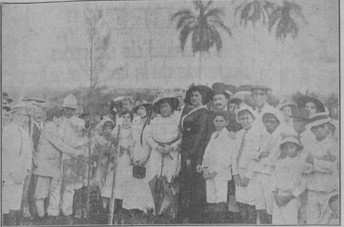
CIENFUEGOS. Recuerdo de la fiesta del Arbol