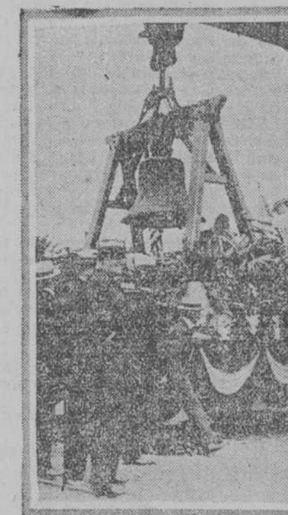
LAS CAMPANAS DE LA LIBERTAD DE LOS ESTADOS UNIDOS.—Esta fotografía fué tomada en los momentos en que se llevaban para la Exposición de Panamá, las campanas que dieron el aviso de la libertad de los Estados Unidos, hace 140 años.

El referido buque tardará aún ocho días en salir, pues suponiendo que embarque tres mil sacos diarios, como tiene que tomar veinte y dos no podrá abandonar el puerto de Matanzas.