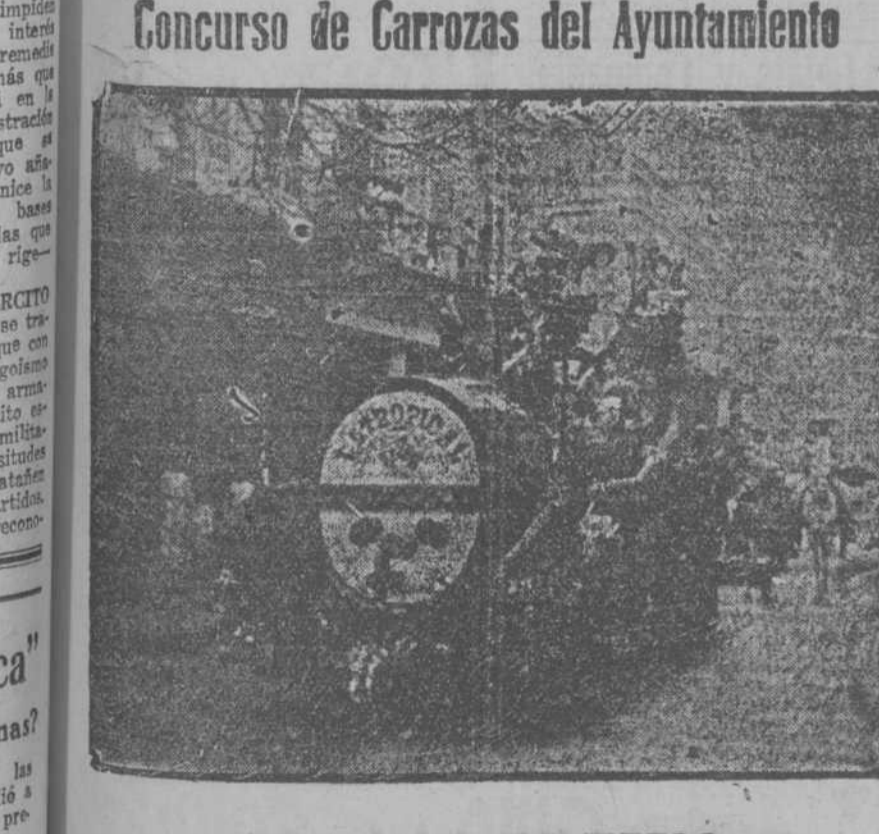
Concurso de Carrozas del Ayuntamiento