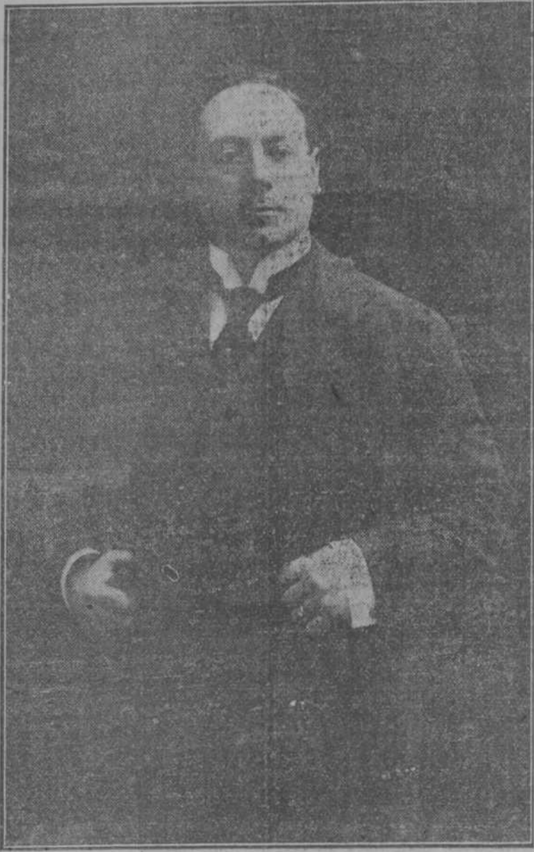
GIUSEPPE DE LUCA, CELEBRE BARITONO QUE "DEBUTA" ESTA NOCHE CON LA OPERA "TOSCA". SE LE CONSIDERA EL MEJOR SCA REPIA.

NACIONAL. — Conforme con lo que ayer dijimos, esta noche se cantará "Tosca." Debutará el tenor Polverosi y el baritono De Luca, dos artistas que vienen precedidos de muy buen cartel, adquirido en teatros de primera categoría.