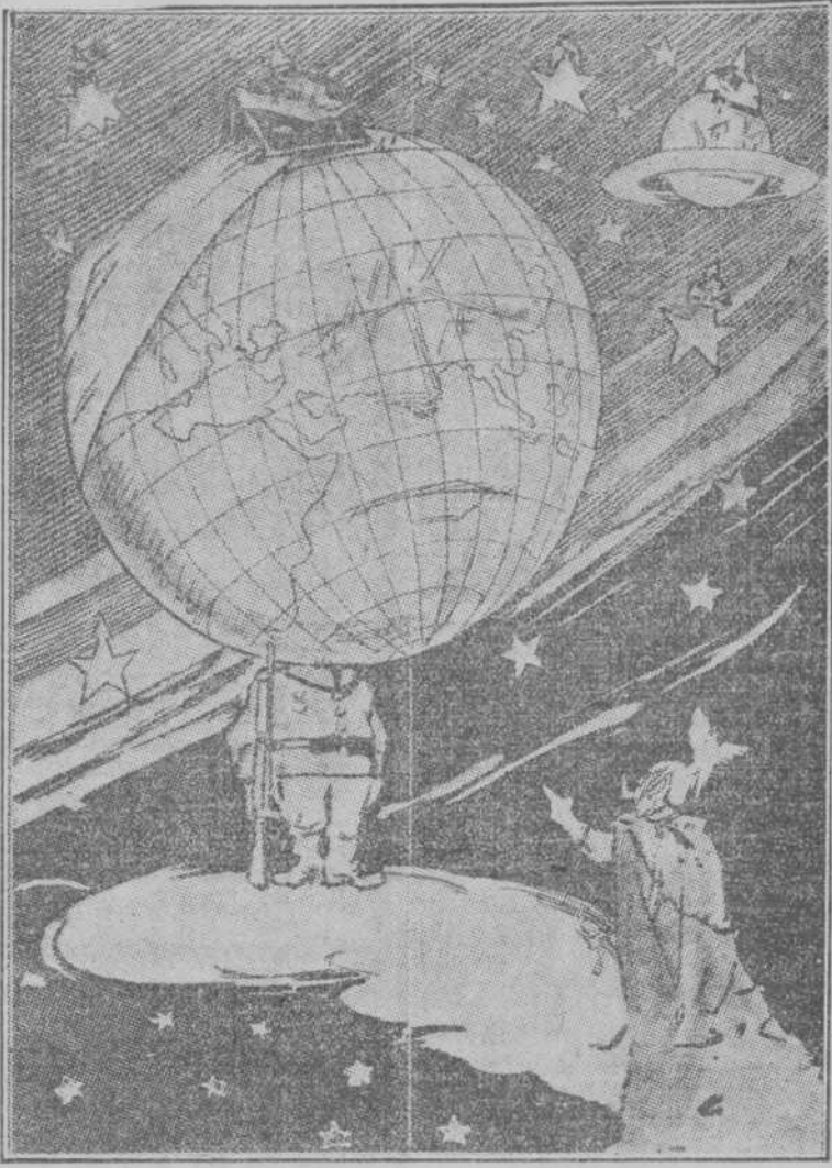
—¡Atención! ¡Avancen! ¡Un... dos!... ¡Un... dos!... (L'Asino, de Roma.)