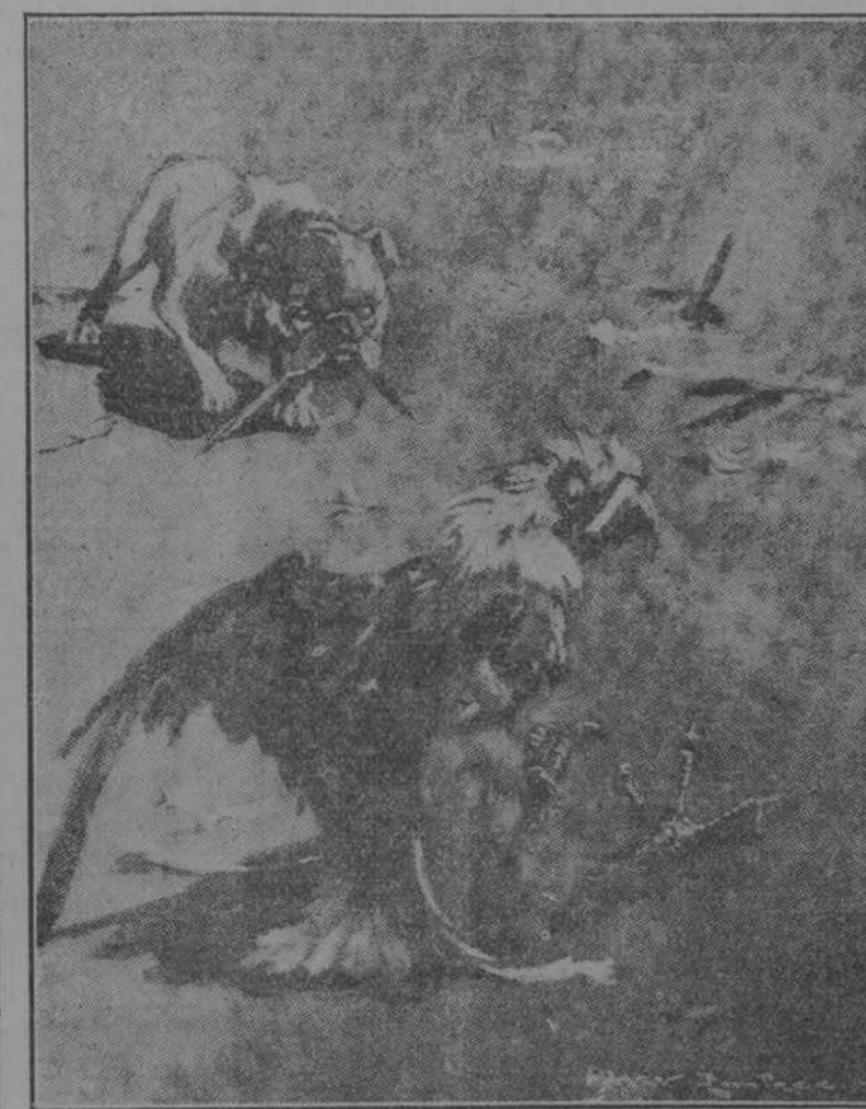
¡Y la lucha es a muerte! (The Sketch, de Londres)