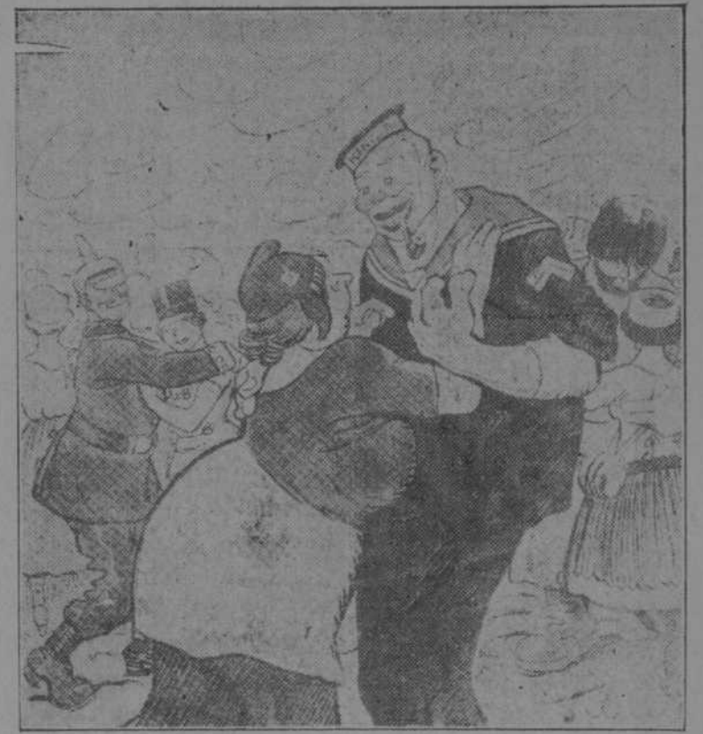
—¿Y qué es ello? —Casi nada... Dos millones de hombres muertos. —"Puede el baile continuar." (Gedeón, de Madrid)