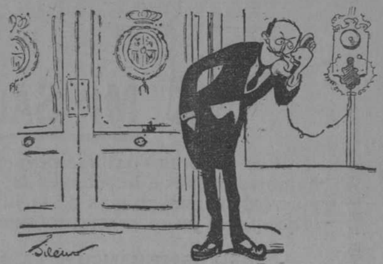
—¿Que ha salido Caro?... Bueno... ¡Y qué! Más caro creyó que nos iba a salir... (Heraldo de Madrid)