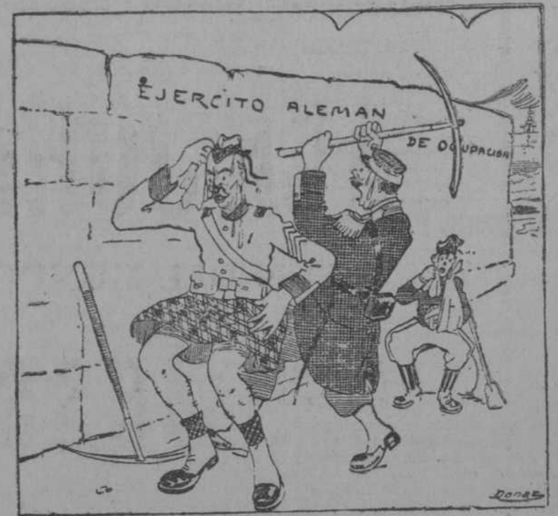
Por macho que hagan no podrán derribarla. (El Mentidero, de Madrid)