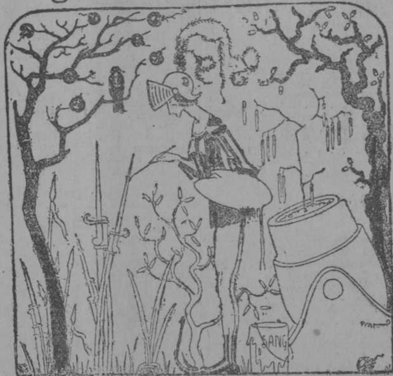
La primavera e neste año. (La Exquella de la Torraza, de Barcelona)