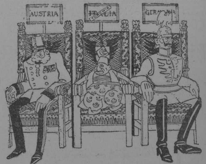
La cantidad es igual, pero la calidad es inferior. (El Número, de Turin)