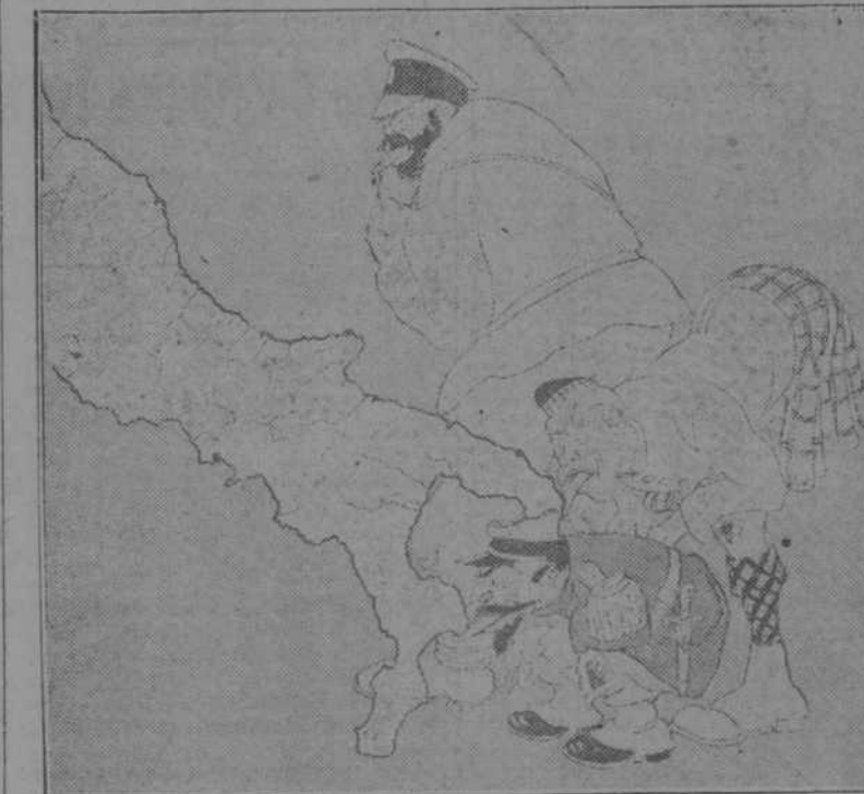
Rusia, Inglaterra y Francia lamiéndole la bota a Italia. (Ingend, de Munich)