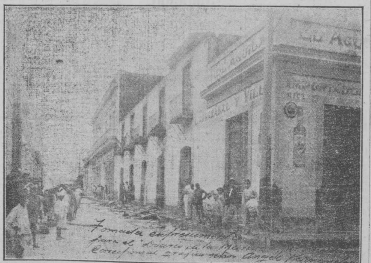
Fotografía del almacén de víveres "El Águila," incendiado en la noche del sábado.

Sobre las 10 y media de la mañana ha llegado directo de New Orleans el vapor correo americano "Exceisor," que trae carga y pasajeros.