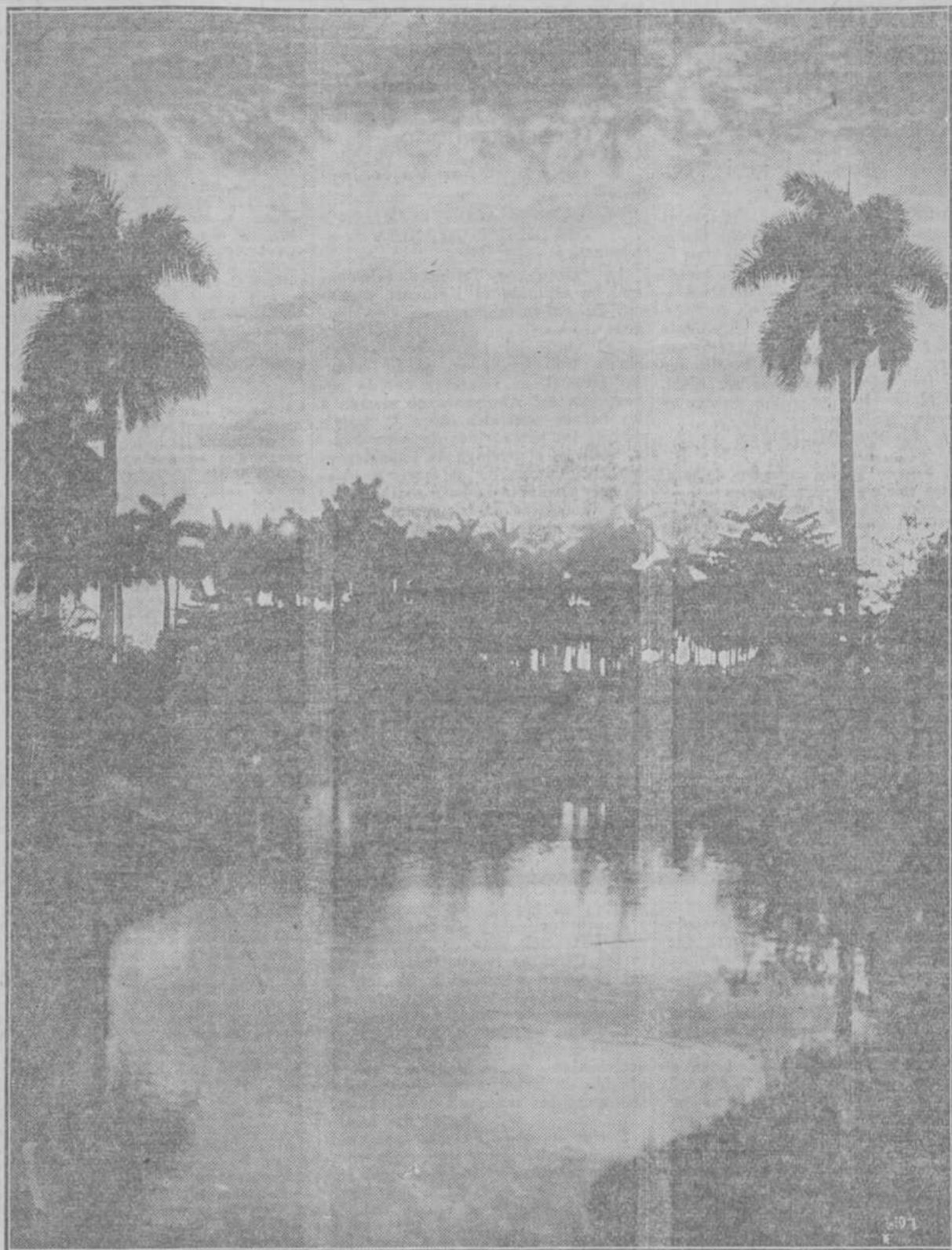
...El paisaje con sus altas palmeras, como un bosque de lanzas y de verdes banderas, sigue igual... (Léase la poesía de Camin en esta página.)