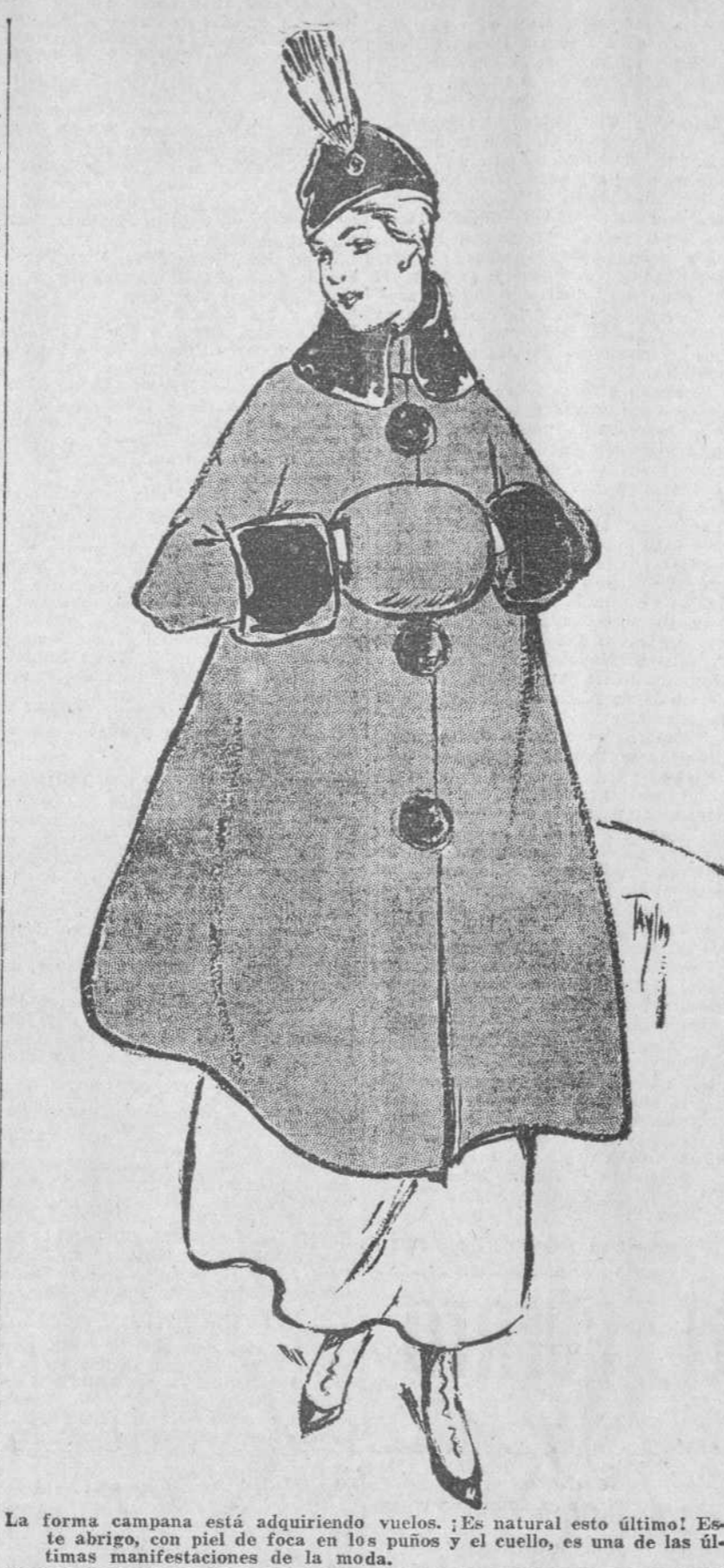
La forma campana está adquiriendo vuelos. Es natural esto último! Este abrigo, con piel de foca en los puños y el cuello, es una de las últimas manifestaciones de la moda.