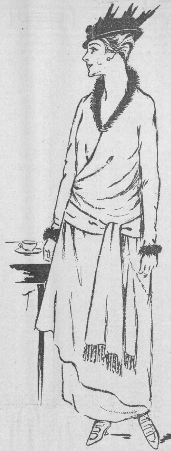
ZAPATOS DE ULTIMA MODA.— Tacón dorado; tres correas. Traje de tarde. Lana gris. Banda de raso. Cuello, puños y flecos de piel. (Mc. Clure 1915.)

—¡Sí! todos los franceses tuviesen el corazón de este simple sacerdote, no permaneceríamos mucho tiempo en este lado del Rin!