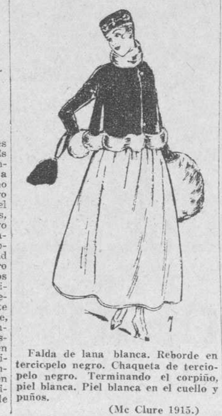
Falda de lana blanca. Reborde en terciopelo negro. Chaqueta de terciopelo negro. Terminando el corpiño, piel blanca. Piel blanca en el cuello y puños. (Mc Clure 1915.)

Madrigal Dime, tirana hermosa, antes que el sí para mí muelle habies, ¿por qué tanto estimar la plata y oro, de fortuna tesoro, si el de naturaleza tienes, en tú semblante y tu cabeza?