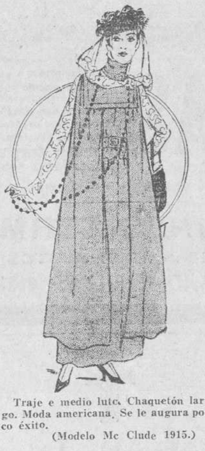
Traje e medio luto. Chaquetón largo. Moda americana. Se le augura poco éxito. (Modelo Mc Clude 1915.)

—¡Hija adoptiva! —repitió el gomoso. —¿Luego no se llama Clara Gervais?